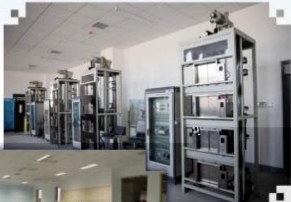
智能电梯安装调试 维护训练场所